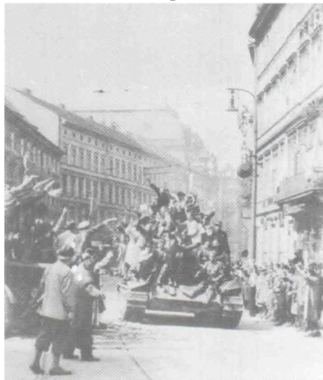
Советские танки на Народном проспекте в Праге