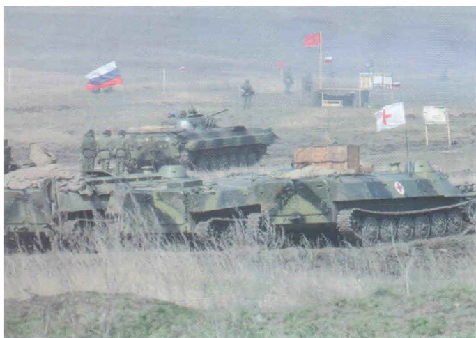
На войсковых учениях 2014г