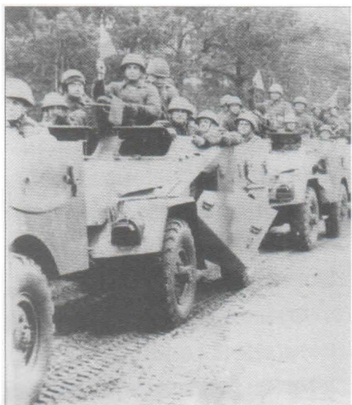
Колонна на марше в направлении границы с ЧССР и ПНР. Август 1968 г.

По окончании Великой Отечественной войны 24 июня 1945 г. 17-я мехбригада была переименована в 17-й гвардейский механизированный Петроковский дважды Краснознаменный орденов Суворова, Кутузова и Богдана Хмельницкого полк. Однако дальнейшее обострение международной обстановки и начало холодной войны вновь привело к гонке вооружений. В 1957 г., в соответствии с директивой Главнокомандующего Сухопутных войск №01111/1/243652 от 12 марта, 17-й гвардейский мехполк был переформирован в 81-й гвардейский мотострелковый полк. В августе 1961 г. полк участвовал в оказании помощи правительству Германской Демократической Республики (ГДР) по возведению границы между Западным и Восточным Берлином.