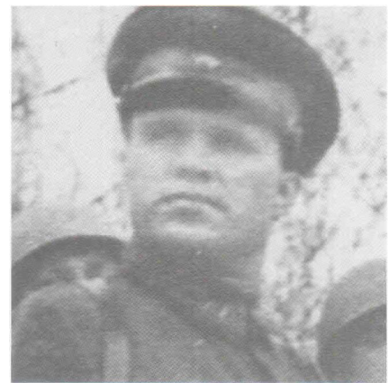
Батальонный комиссар Юрасов Григорий Иванович