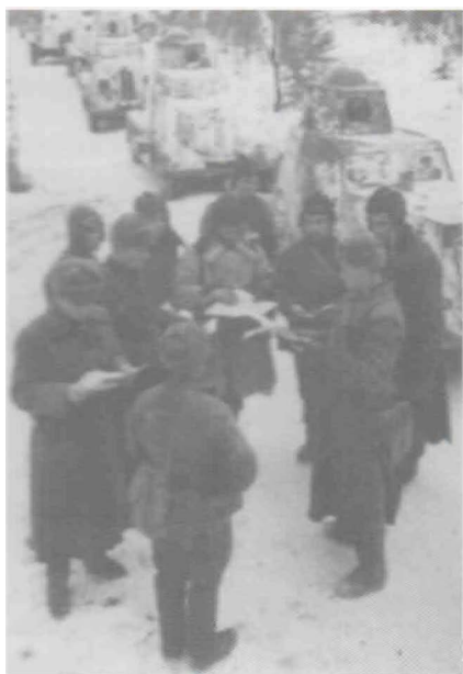
Уточнение боевой задачи колонне бронемашин на занятие огневой позиции в районе г. Можайска

Осенью 1941 г., в период наиболее напряженных боев на подступах к столице Советского Союза, с 6 по 23 октября 1941 г. по приказу ГКО СССР полк в составе 82 МСД был переброшен в город Загорск (ныне Сергиев Посад) в распоряжение командующего Западным фронтом, а с 25 октября 82-я мотострелковая дивизия была передана в 5-ю армию и в ночь на 26 октября 1941 г. прибыла на 74-й км Минского и Можайского шоссе, где в 9.00 была остановлена и с ходу вступила в бой с частями 7-й пехотной дивизии вермахта, шедшей на Москву из Можайска. 2 ноября 1941 года полк вступил в бой с превосходящими силами противника (197 ПД) и разгромил её основную группировку под д. Капань. Находясь в полуокружении, полк продолжал удерживать занимаемый рубеж обороны и нанёс противнику большие потери. 3 ноября 1941 г. противник при поддержке танков 6 раз переходил в атаку против 210 МСП. Полк показал исключительную высокую стойкость и нанёс противнику большие потери.