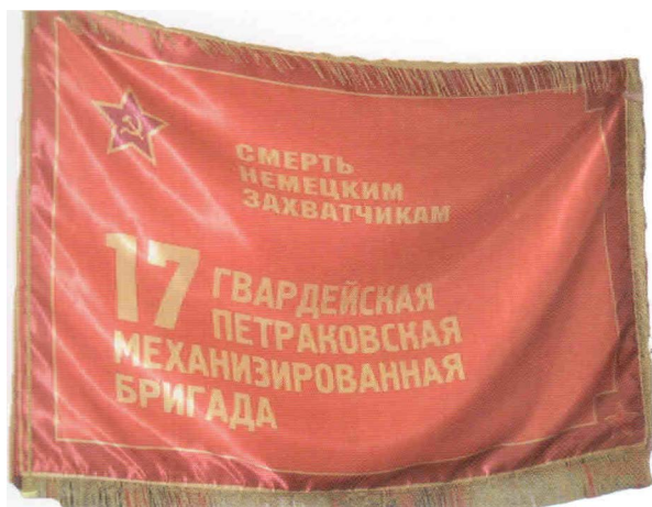
Боевое Знамя 17-й гвардейской механизированной Краснознамённой бригады