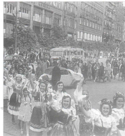
Население Праги встречает советские войска