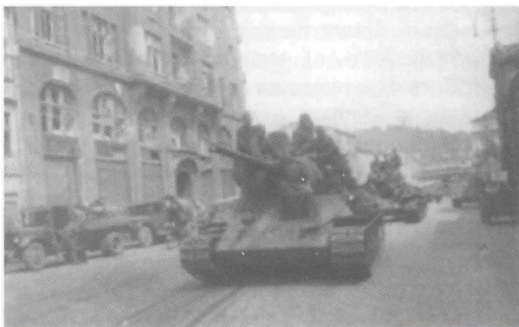
Танки 17-го гвардейского МК на улицах Львова

Указом ПВС СССР от 10 августа 1944 года за овладение городом Львов 17-я гвардейская Краснознаменная механизированная бригада была награждена орденом Суворова II степени.