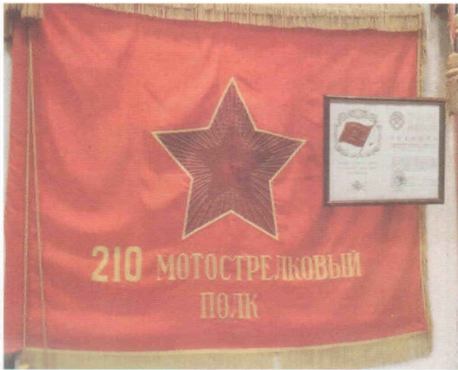
Боевое Знамя 210-го мотострелкового полка

Политическая обстановка в Европе в конце 30-х годов и угроза начала новой мировой войны потребовали усиления боевой и мобилизационной готовности Рабоче-Крестьянской Красной Армии, увеличения ее кадрового состава, в том числе и стрелковых войск.