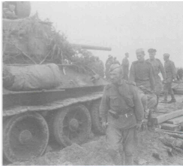
Танковая переправа через р.Одер

В январе-марте 1945 года 17 гвардейская механизированная бригада участвовала в боевых действиях по освобождению Польши. В Сандомирско-Силезской наступательной операции бригада отличилась в боях под городом Петракув (Петроков). Приказом Верховного Главнокомандующего от 18 января 1945 года № 227 за овладение городом Петракув личному составу 6 гв. мк была объявлена благодарность, а приказом ВГК № 014 от 19.02.45 бригаде присвоено почетное наименование «Петроковская». Продолжая наступление, ее части 25 января с ходу форсировали реку Одер (Одра) в районе Кебена (35 км западнее города Равич) и захватили плацдарм на левом берегу. В феврале-марте 1945 года бригада вела бои в Силезии.