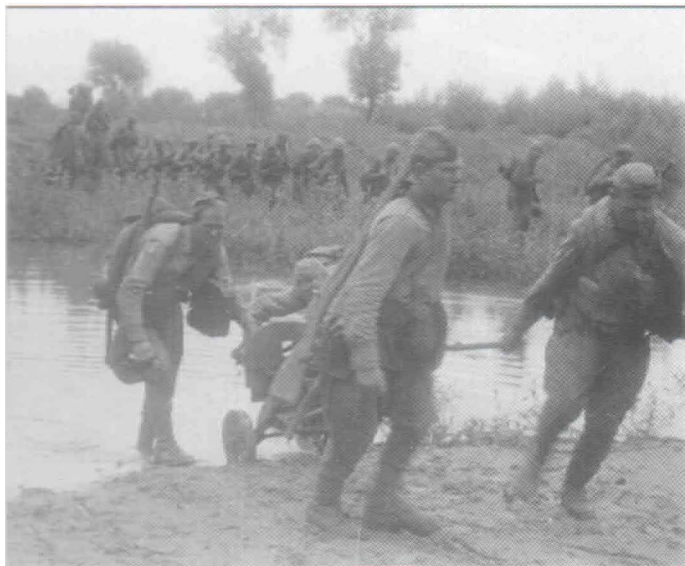
Переправа советских войск через реку Вислу

15 марта из района города Олау 17 гв. мехбригада перешла в наступление. Через 3 дня со взятием города Нойштадт Оппельская вражеская группировка была окружена. Бригада оказалась на внешнем фронте окружения. В ночь на 18 марта враг ввёл в действие свой резерв в направлении города Ротхаус. Схватка продолжалась два дня. Враг предпринимал непрерывно одну за другой яростные атаки. Отдельные населённые пункты и рубежи неоднократно переходили из рук в руки. После кровопролитных боев враг был отброшен назад с большими потерями. Указом Президиума Верховного совета СССР от 26 апреля 1945 года за овладение городами Ратибор и Бискау бригада была награждена орденом Кутузова 2-й степени.