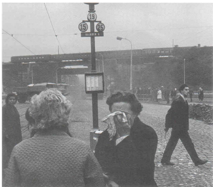
Прага 1968 год

10 декабря 1968 г. приказом Министра обороны СССР №242 за «образцовое выполнение задания командования и интернационального долга по оказанию помощи трудящимся Чехословакии в борьбе с контрреволюционными элементами и проявленные при этом отвагу и мужество» всему личному составу полка объявлена благодарность.