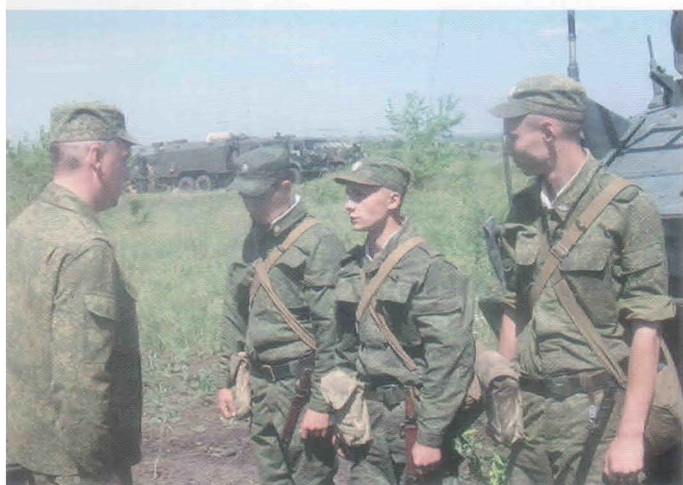
Постановка боевой задачи