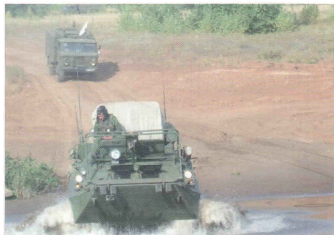
Преодоление водной преграды