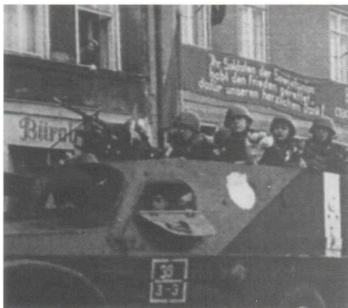
Подразделения 81 гвардейского мотострелкового полка возвращаются из Праги в Эберсвальде