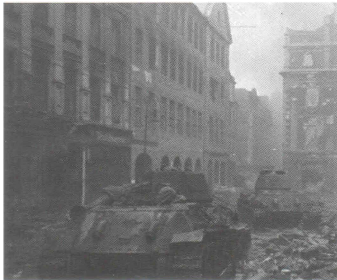
Танки 17-й гвардейской Краснознамённой механизированной бригады вошли в город Бискау