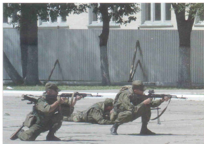
Учебные занятия по стрельбе