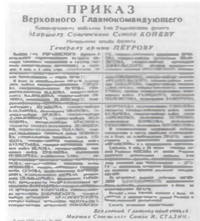
Приказ об объявлении благодарности войскам за освобождение Праги