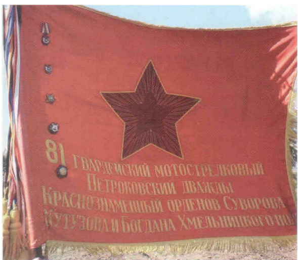
Боевое Знамя 81 гвардейского Петроковского дважды Краснознаменного орденов Суворова, Кутузова и Богдана Хмельницкого полка

В 1993 году полк выведен на территорию Российской Федерации и дислоцирован в поселке Рошинский Волжского района Самарской области, войдя в состав 2-й гвардейской танковой армии Приволжского военного округа. С 14 декабря 1994 г. по 9 апреля 1995 г.