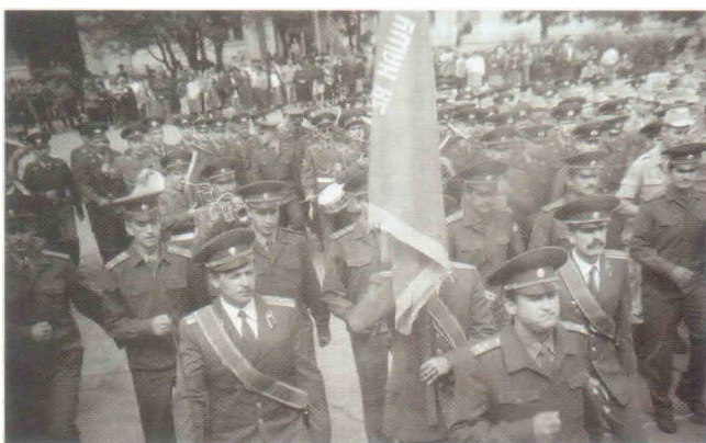
Торжественное построение личного состава 81-го гвардейского МСП в честь встречи ветеранов 81-го гвардейского полка, участников Великой Отечественной войны

По оценке Министра обороны Российской Федерации П.Грачева, Начальника Генерального Штаба Вооруженных Сил РФ М.Колесникова 81 гвардейский мотострелковый полк задачу в городе Грозный выполнил, обеспечив ввод в город других федеральных сил, проявив стойкость и решительность. Звание Герой Российской Федерации присвоено военнослужащим полка подполковнику И.Станкевичу, старшему прапорщику Г. Киреченко и приданному авианаводчику капитану А.Кирьянову (по-смертно). Более 500 военнослужащих полка награждены орденами и медалями.