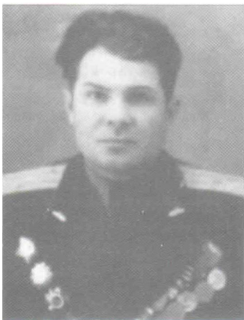
Командир бригады гвардии полковник Н.Я. Селиванчик

Парец, Магвардт, Борним и совместно с 35 мбр овладеть г.Потсдам. В боях за г.Потсдам бригадой было уничтожено до 200 солдат и офицеров противника, захвачено 4 склада с военным имуществом, взято 800 пленных.