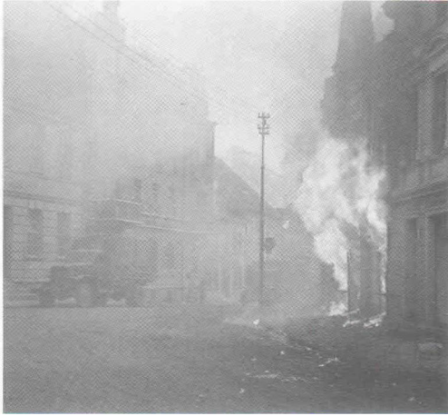
Пылающие города Померании

В ходе Берлинской наступательной операции бригада последовательно форсировала реки Нейсе, Шпрее и, развивая наступление в обход Берлина с юга, во взаимодействии с другими соединениями участвовала в овладении городом Потсдам.